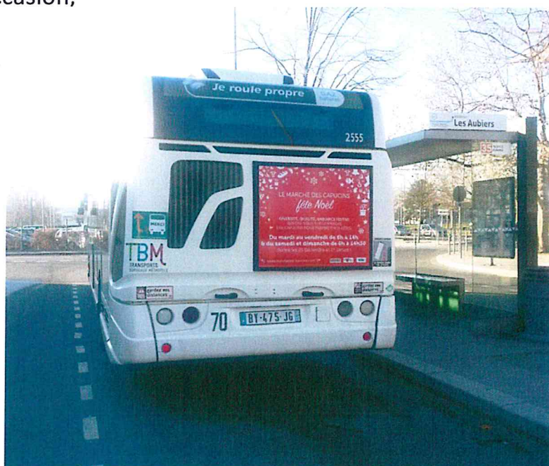
Sud Ouest Gourmand Sept 2016