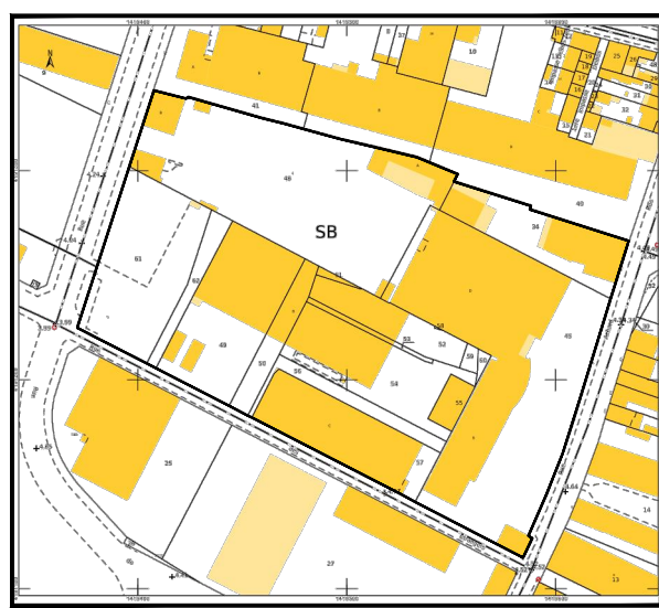
Plan sommaire - Plan parcellaire - Echelle : 1/4000