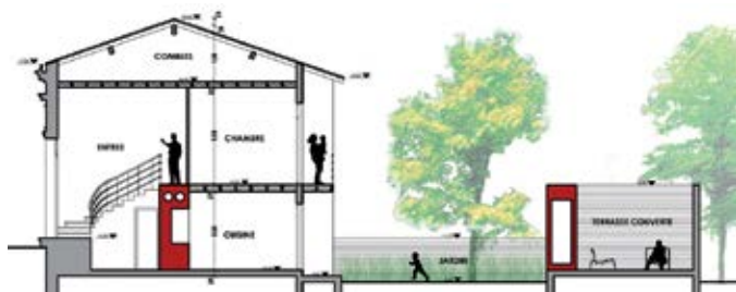
Exemple de plan de coupe (état projeté)

4 Un plan de coupe précisant l'implantation de la construction par rapport au profil du terrain.