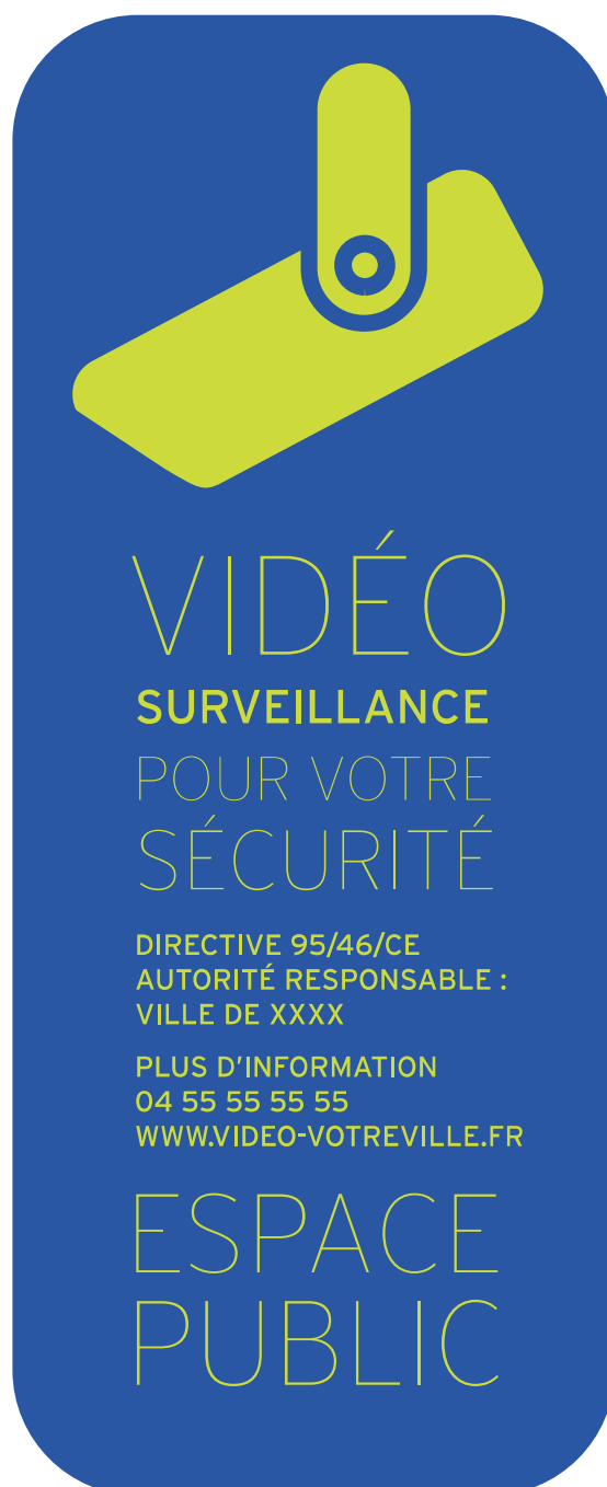
Panneau type Caméra