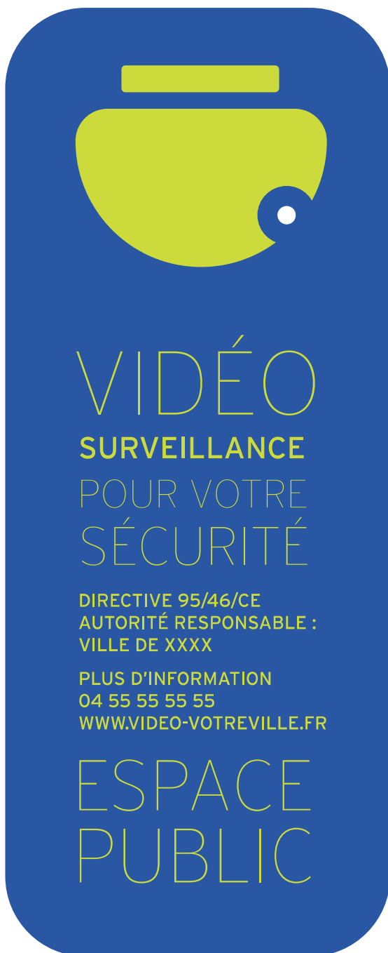
Panneau type Dôme