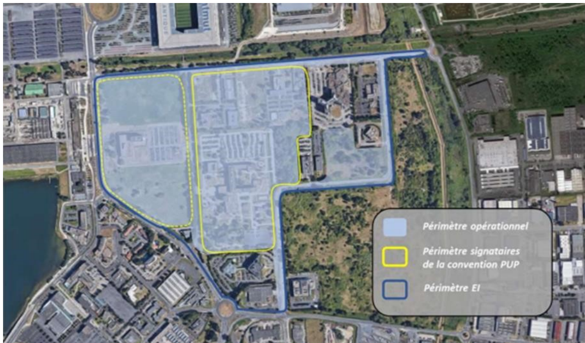
Périmètres prévisionnels d'intervention, susceptibles d'évoluer à la marge