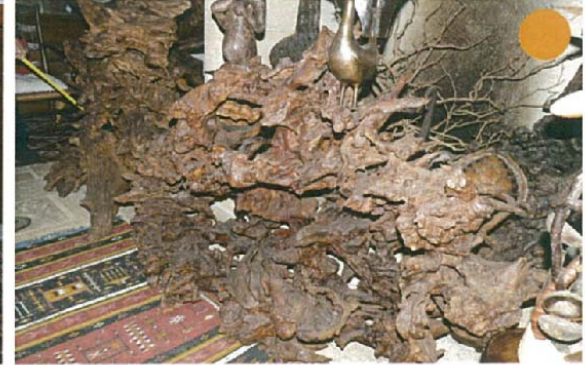
Le secret percé H.110xL.180xl.80 15000 €