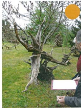
L'étoile des champs H.190xL.240xl.100 6000 €

Intitulé de l'œuvre Dimensions Valeur estimée