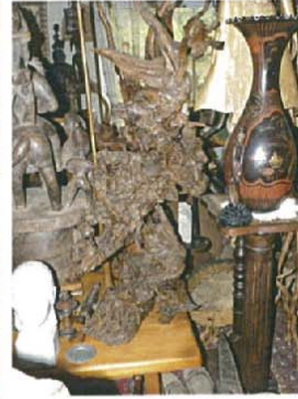
Le cauchemar des innocents H.130xL.60xl.60 7000 €