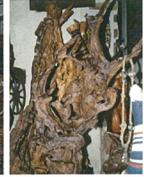
L'élan mystique H.120xL.80xl.40 1500 €