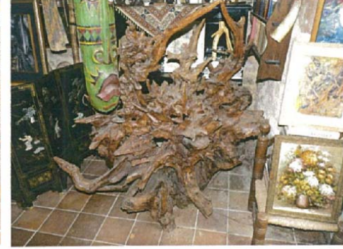
La citadelle assiégée H.150xL.150xl.70 8000 €