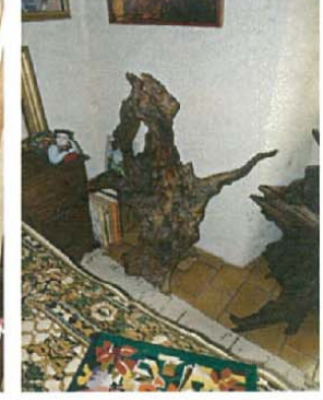
L'humeur colérique H.115xL.90xl.50 1500 €