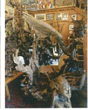
La nef oubliée H.170xL.160xl.120 10000 €