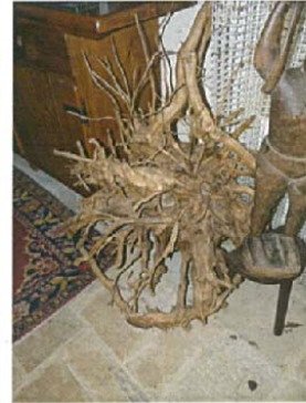
La synapse écervelée H.135xL.80xl.80 5000 €