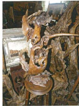
Le manchot benoît Non mesurée 1500 €