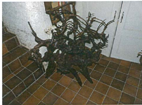
La vie brûlée H.165xL.112xl.72 5000 €