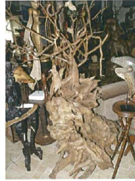
Le rocher des Parques H.210xL.160xl.130 6000 €