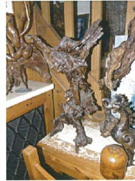
La victoire en chantant Non mesurée 1500 €