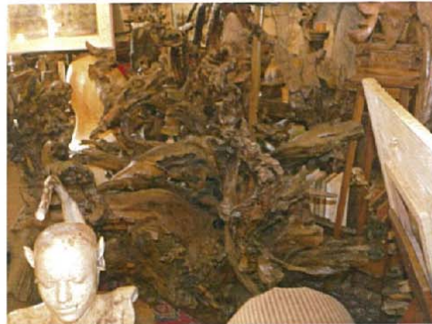
L'efflorescence des bois H.135xL.160xl.140 15000 €