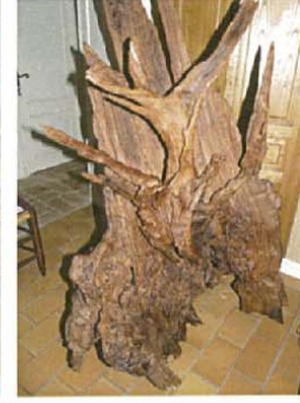
L'hymne à la terre H.160xL.120xl.80 8000 €