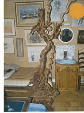
La stèle arborescente H.220xL.70xl.70 5000 €