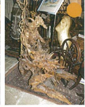
L'être captif H.180xL.140xl.100 6000 €