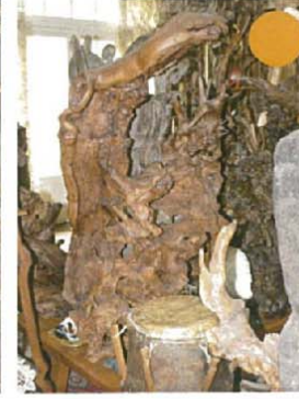
Le bouclier barbare H.130xL.80xl.60 7000 €