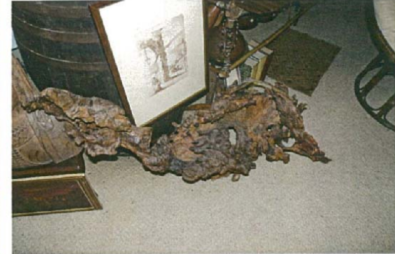
La momie caprine H.180xL.115xl.90 5000 €