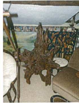
L'éruption pétrifiée H.130xL.90xl.80 3000 €