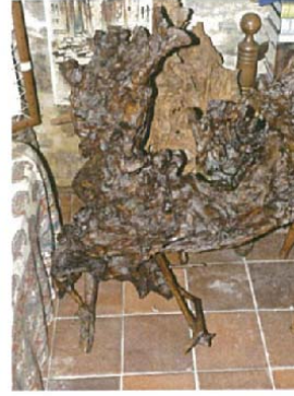
Le feu de camp H.90xL.90xl.50 1500 €