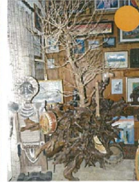
Le buisson ardent H.280xL.180xl.90 15000 €