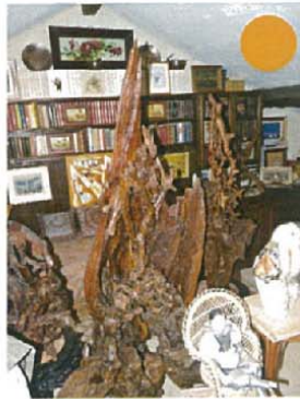
La matrice du monde H.190xL.140xl.100 8000 €

Intitulé de l'œuvre Dimensions Valeur estimée