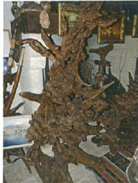
La puissance vitale H.200xL.110xl.70 8000 €