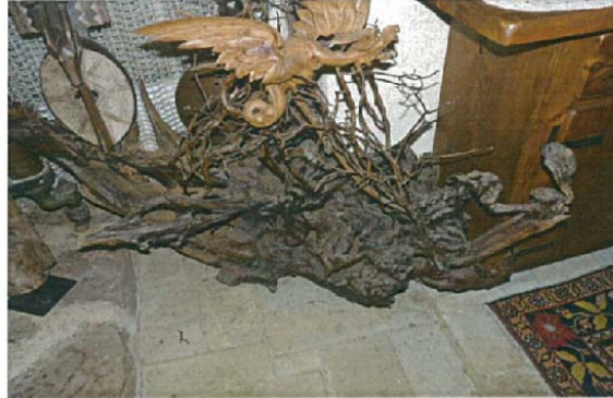
Le vaisseau fantôme H.160xL.140xl.80 8000 €