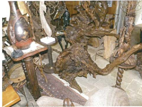
La tempête équatoriale H.170xL.170xl.120 15000 €

Intitulé de l'œuvre Dimensions Valeur estimée