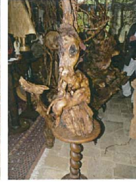
L'oiseau des îles H.140xL.80xl.70 1500 €