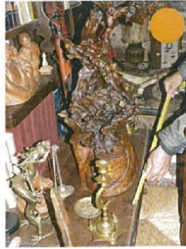
La bourrasque d'antan H.90xL.60xl.40 1500 €