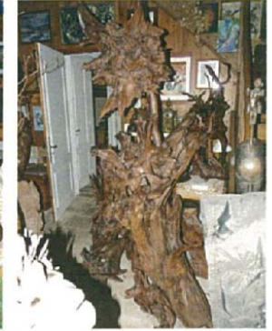
Le poème épique H.230xL.170xl.120 15000 €