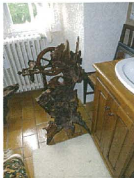
Le monstre entomologique H.90xL.90xl.70 3000 €