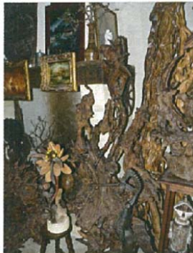
L'hallucination vespérale H.200xL.80xl.80 8000 €