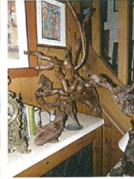
Le songe érotique Non mesurée 1500 €