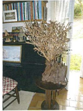
L'explosion printanière H.95xL.80xl.60 1500 €